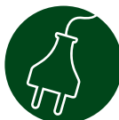
Lyspærer/ batterier/ Småelektrisk